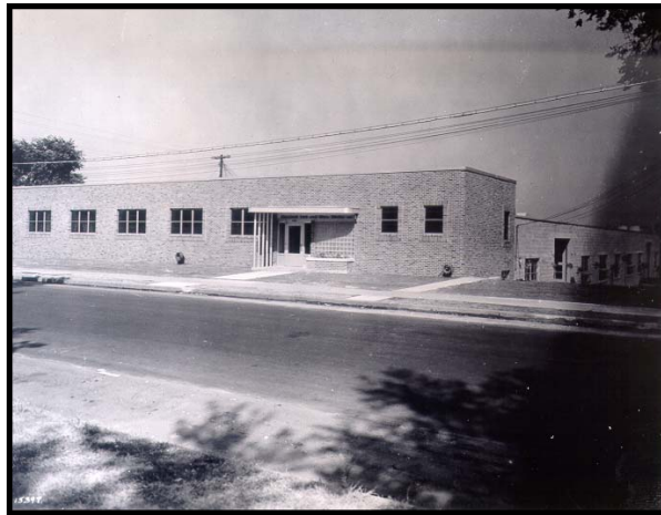
Fotografía antes de la adición de la oficina en 1964-65

Debido al crecimiento, Standard Iron se mudó en 1945 a un Nuevo edificio sobre 2 nd Street North entre 27 th y 30 th Avenue North.